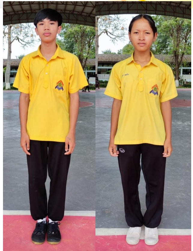
มัธยมศึกษาตอนปลาย

๑๗.๑ ให้ใช้ชุดพลศึกษาที่โรงเรียนกำหนดให้เท่านั้น คือกางเกงวอร์มสีดำตามแบบของโรงเรียนเสื้อโปโลแบบเชิ้ต กระเป๋าก็กเครื่องหมายของโรงเรียน ปักชื่อที่อกด้านขวา และปักจุดตามระดับชั้นที่ปกเสื้อด้านซ้าย ด้วย ด้ายสีน้ำเงิน โดยอนุญาตให้สวมเสื้อพลศึกษามาจากบ้านได้ในวันที่มีเรียนพลศึกษา และต้องปักชื่อ-สกุล ด้วย ด้ายสีน้ำเงินที่อกเสื้อด้านซ้ายขนาด ๐.๕ ซม.