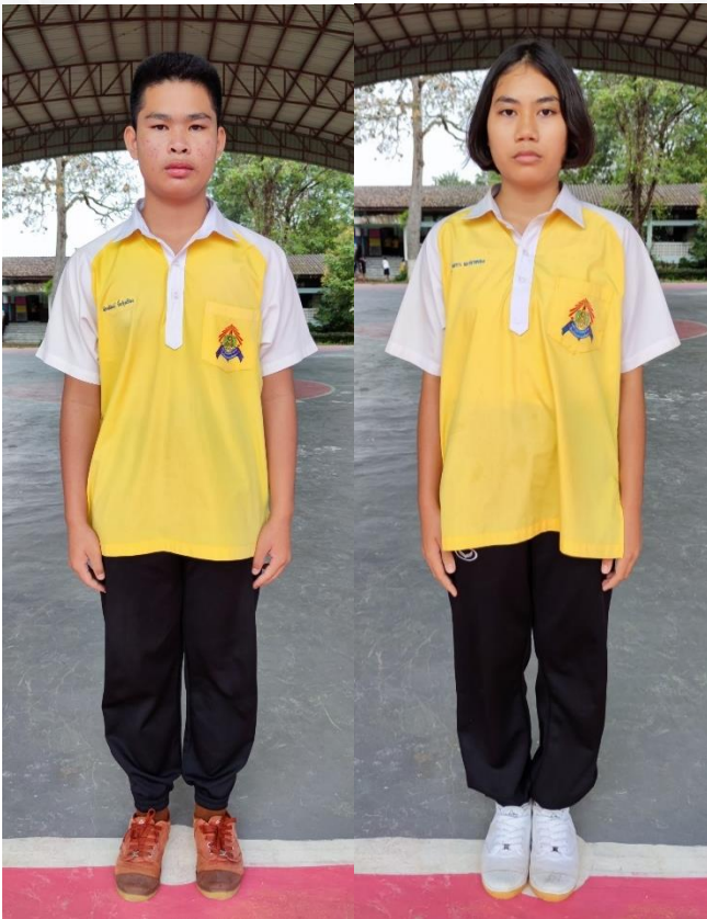
มัธยมศึกษาตอนต้น