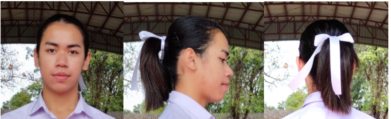
ทรงผมนักเรียนชาย(LGBTQ+) แบบไว้ยาวรวบให้เรียบร้อย

๘.๒ นักเรียนหญิงให้ไว้ผมสั้นหรือผมยาวก็ได้