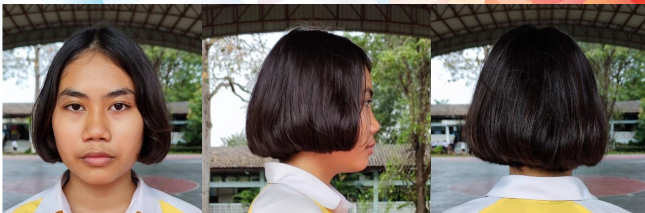
ทรงผมนักเรียนหญิงแบบสั้น