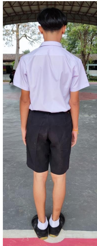
ชุดนักเรียนชายมัธยมศึกษาตอนปลาย