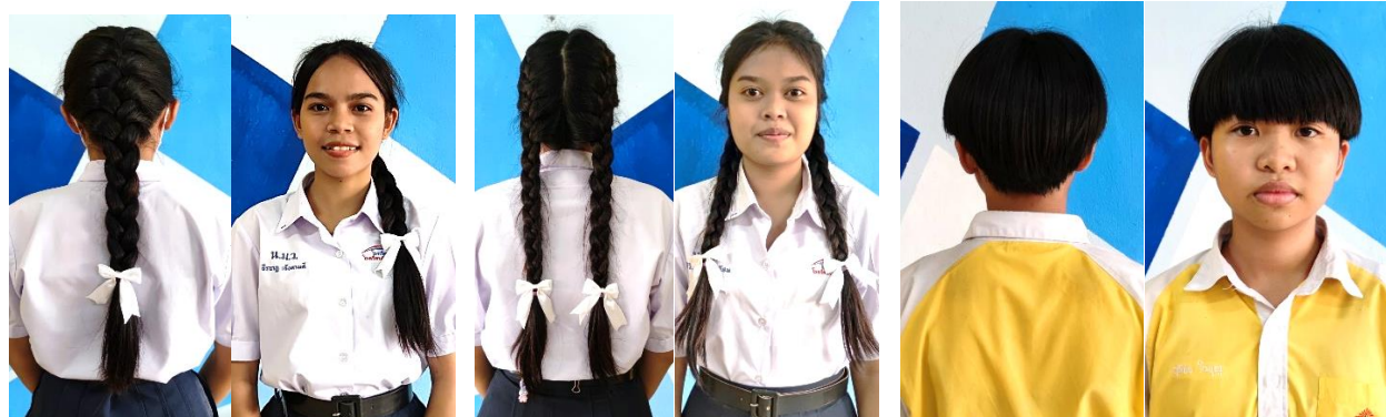
ทรงผมนักเรียนหญิงแบบอนุโลมถักเปียหรือตัดสั้นเปิดหูได้ (LGBTQ+)