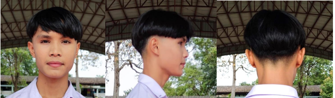
ทรงผมนักเรียนชายแบบรองทรงต่ำ