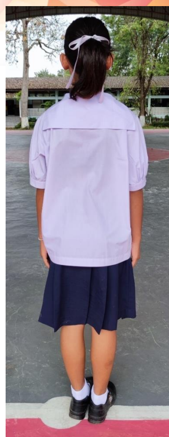
ชุดนักเรียนหญิงมัธยมศึกษาตอนต้น