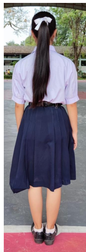
ชุดนักเรียนหญิงมัธยมศึกษาตอนปลาย