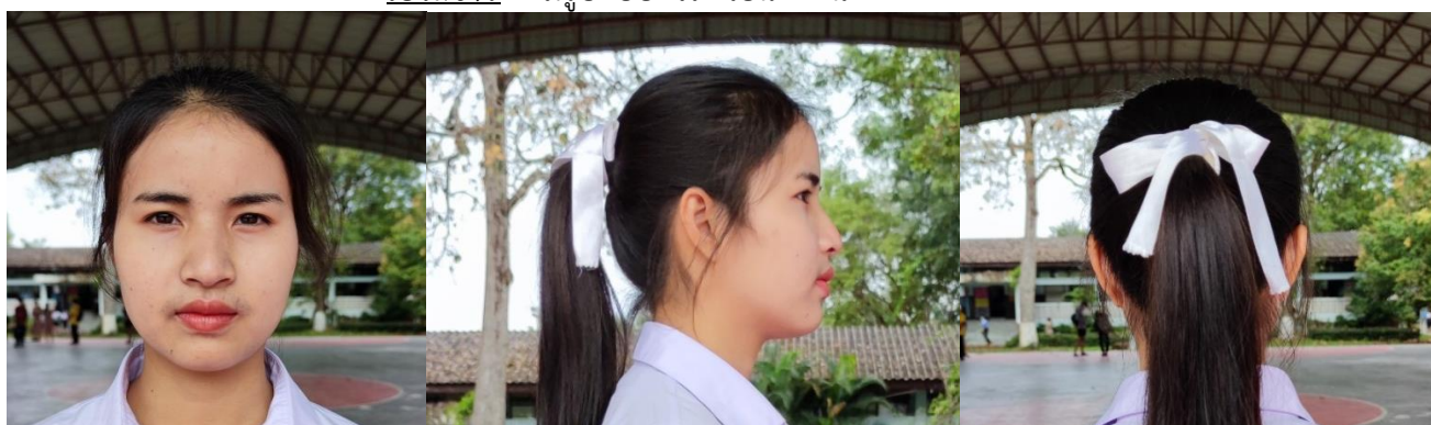
ทรงผมนักเรียนหญิงแบบยาว