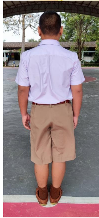
ชุดนักเรียนชายมัธยมศึกษาตอนต้น