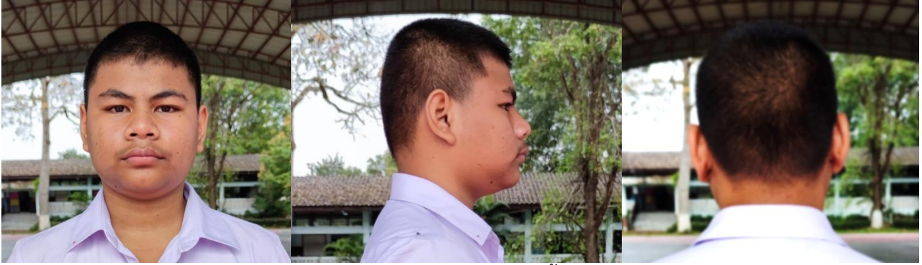
ทรงผมนักเรียนชายแบบสั้น

๘.๑ นักเรียนชาย ทรงผม จะไว้ผมสั้นหรือผมยาวก็ได้ กรณีไว้ผมยาวด้านข้าง ด้านหลังต้องยาว ไม่เลยตีนผม ด้านหน้าและกลางศีรษะให้เป็นไปตามความเหมาะสมและมีความเรียบร้อยเหมาะสมกับสภาพการเป็นนักเรียน